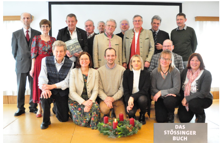
In einer feierlichen Präsentation wurde das neue Stössing-Buch vorgestellt.